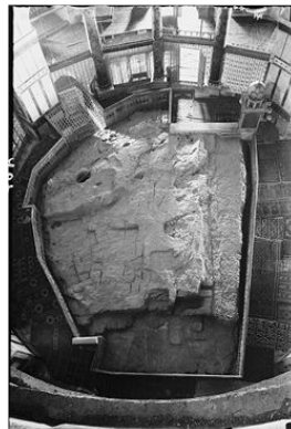
צילום אבן השתייה

אם-כן, אֶשְׁרֵי הַמְּחַפָּה... (דניאל יב' 12) = מכוון לרגע בו כספת אבן השתייה "האבן הראשה" תנופץ... כלומר, לרגע בו יתגלו הלוחות = (דברים ח' 18) = וַיִּכְתְּבֶם עַל-שְׁנֵי לַחַת אֲבָנִים וַיִּתֵּנֶם אֵלָי... השמורים בכספת האבן... היא, כספת האבן, הָאֲבֹן הָרִאשָׁה אותה ייסד שְׂרָיָה כֹהֵן הָרִאשׁ... = (ירמיה נב' 24) = לאחר החורבן ככספת, מאבני המקדש שחרב. בה, בכספת האבן, נשמרים לוחות הברית שמא יפלו בשבי בידי זרים - עַד-מֵתִי? כִּי לְמוֹעֵד מוֹעֲדִים וְחַצֵּי וּכְכֹלֹת נִפְץ יָד-עַם-קִדְשׁ--תִּכְלִינָה כָּל-אֱלֹהִים... (דניאל יב' 7)