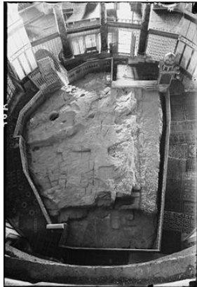
צילום אבן השתייה... הר הבית...

לְכֹן כֹּה אָמַר אֲדֹנָי יְהוִה הִנְנִי יֹסֵד בְּצִיּוֹן אֶבֶן אֶבֶן בַּחֹן פְּנֵת יִקְרָת מוֹסָד מוֹסָד-- הַמֵּאֲמִין לֹא יַחִישׁ... (ישעיה כח' 16)