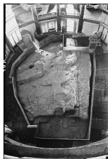
צילום אבן השתייה