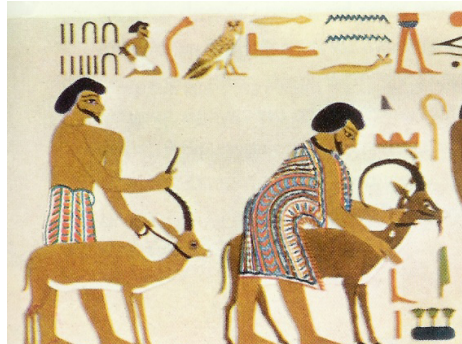
קטע זה של ציוור הקיר כולל את שם אֲבִישִׁי והמספר 22 + 15 = 37

שימור כמות: [אל-ישר]=[22+15]=[ישראל] משמר תיעוד למסר היסטורי המתאר את ירידת יַעֲקֹב למצרים, בכתובת שיוחסה ליוסף "צִפְנַת פְּעִנַח" ותוארכה לשנת 6 למלכות פרעה ח'-חיפר, בציוור הקיר במקדש קבר הנסיך חנום חותפ' II.